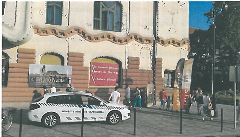
A Nemzeti Adó- és Vámhivatal autója a Cifrapalota előtt