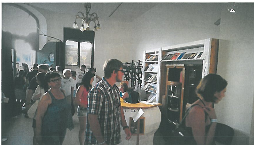
Gyülekezés a Cifrapalota előterében