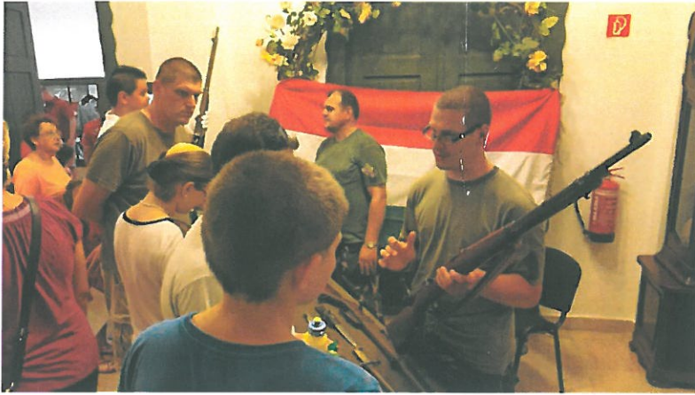
Had-, és Kultúrtörténeti Egyesület