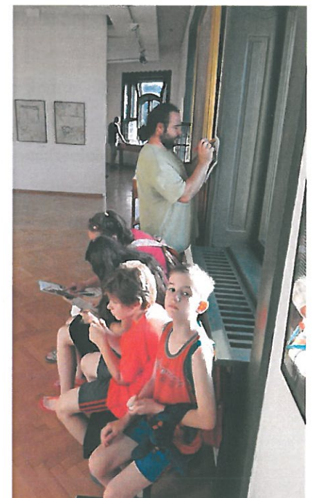
Wanted! Körözés a Cifrapalotában