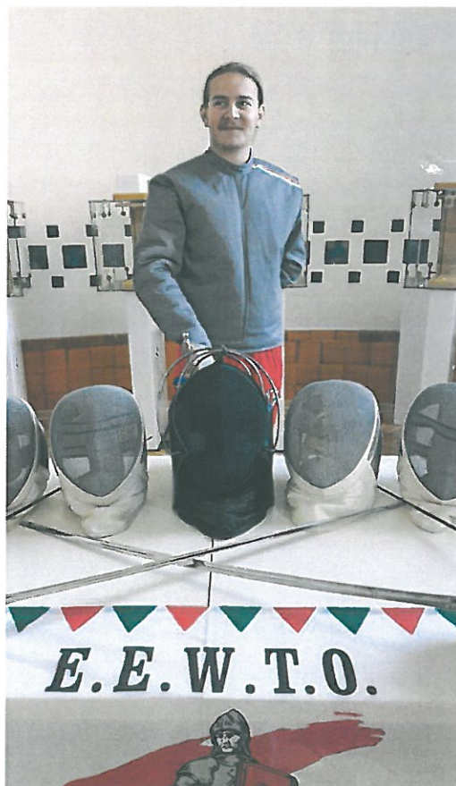
Kecskeméti Szablayvívó Iskola