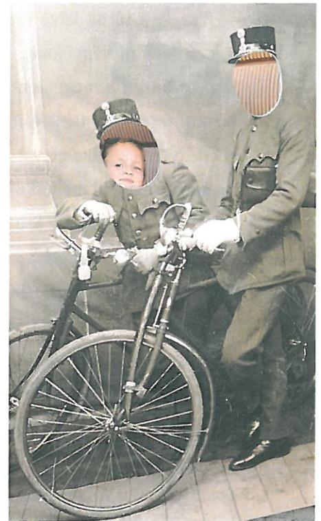
Fotózkodás a Pénzügyőr- és Adózástörténeti Múzeum paravánjával