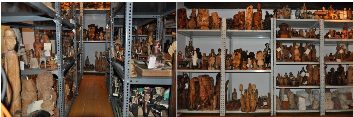
A szobrok új elhelyezése.

Mint ahogyan erre már a fentiekben történtek utalások, a munka elvégzését követően a Pannon Protect Kft. egy Corroventa 300 típusú szárítógépet helyezett el a raktározó térben, ami a helyiségek páratartalmát a beállított értéken tartja. Ezzel megakadályozza, hogy a fatárgyak a változó páratartalom miatt repedzenek, és megakadályozza a penészfertőzés kialakulását is.