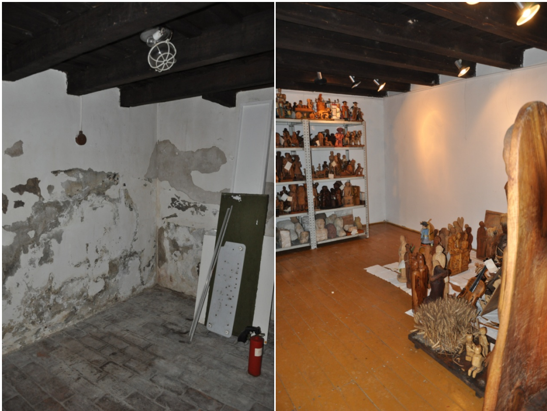
Az üres régi raktár.

Első lépésben a szobrok kikerültek a korábbi szűk, szellőzés nélküli és fűtetlen, párás helyiségből. A szárító, a folyamatos szellőzés, a fűtés, valamint a vegyszer egy határozott ideig megvédi a szobrokat. A szobrok elhelyezése a fertőtlenített salgópolcokon történt, szorosan egymás mellett, mégis szellősen.